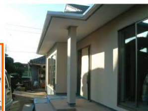
・ゆったり玄関廻り