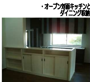
・オープンキッチンとダイニング取組