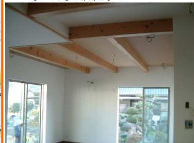
・梁を味わったリビング天井