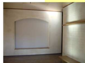
・ケイソウ土塗りの玄関ホール